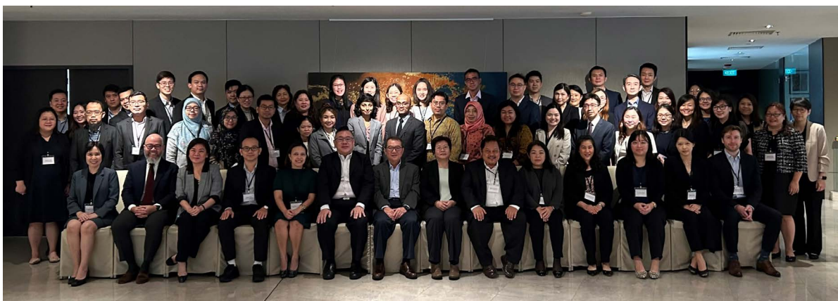
会财局代表团参加东盟审计监管机构小组与财务报表监督小组的联合研讨会。

会财局亦与来自新加坡会计与企业管制局、印尼金融服务监管中心、马来西亚审计监管局、菲律宾证券交易委员会、泰国证券交易委员会以及柬埔寨会计和审计监管局的代表作交流。