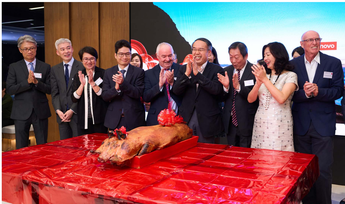
财经事务及库务局局长许正宇先生，GBS，JP（右四）以及会财局主席黄天祐博士，SBS，JP（右三）在财经事务及库务局常任秘书长甄美薇女士，JP（右二）、财经事务及库务局副局长陈浩濂先生，JP（左四）、董事局成员的陪同下共同主持切烧猪仪式。