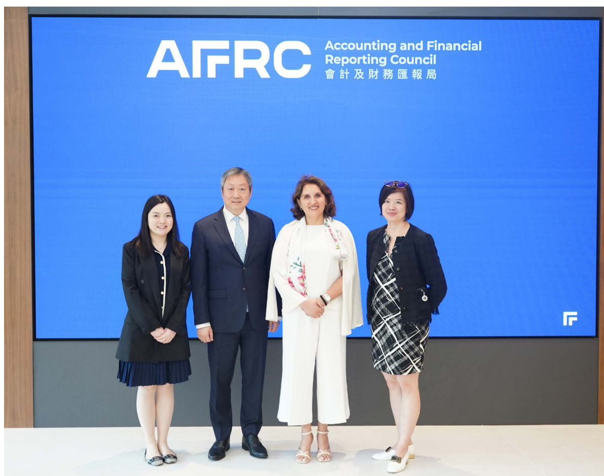
国际会计师联合会主席Asmâa Resmouki女士（右二）分享对会计专业发展的看法。

2023年7月14日，我们接待了国际会计师联合会主席Asmâa Resmouki女士。本局简介了会财局并概述了香港的会计和监管环境后，Resmouki女士与我们分享了国际会计师联合会的三个目标：(i)协助会计专业团体发展为面向未来的专业；(ii)支持制定及采用高质素准则；及(iii)充当会计专业的全球代言人。她亦表达了联合会与会财局加强合作的意向。