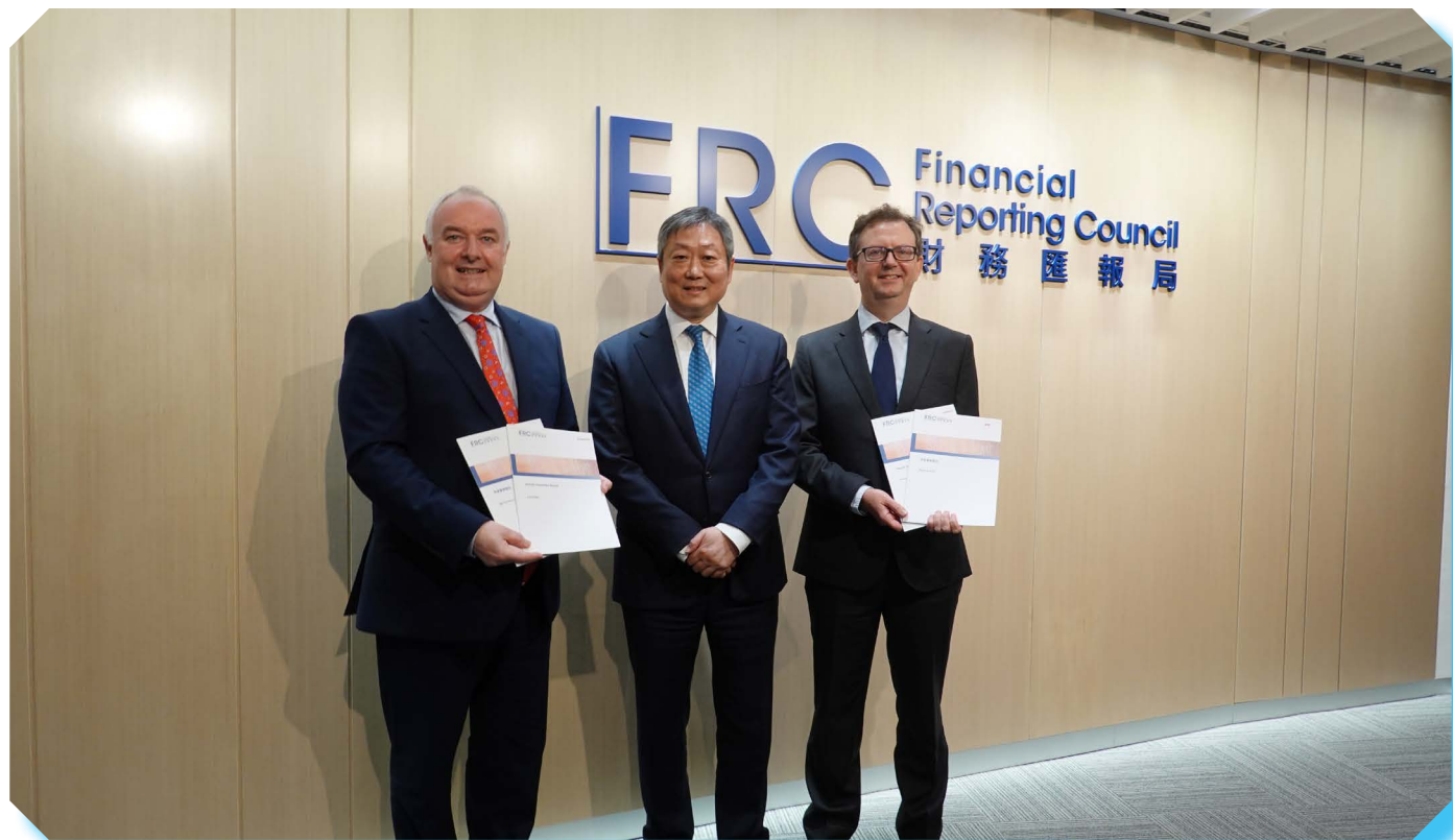
财汇局主席黄天祐博士(中)、行政总裁马力先生(左)及查察部主管李斯先生与传媒会面。

透过新闻发布会公布我们的监管发现，可让财汇局有效履行法定职能，以及令受监管人士在上市实体的财务汇报及审计方面向公众负责，亦让本局就有关事宜教育公众。